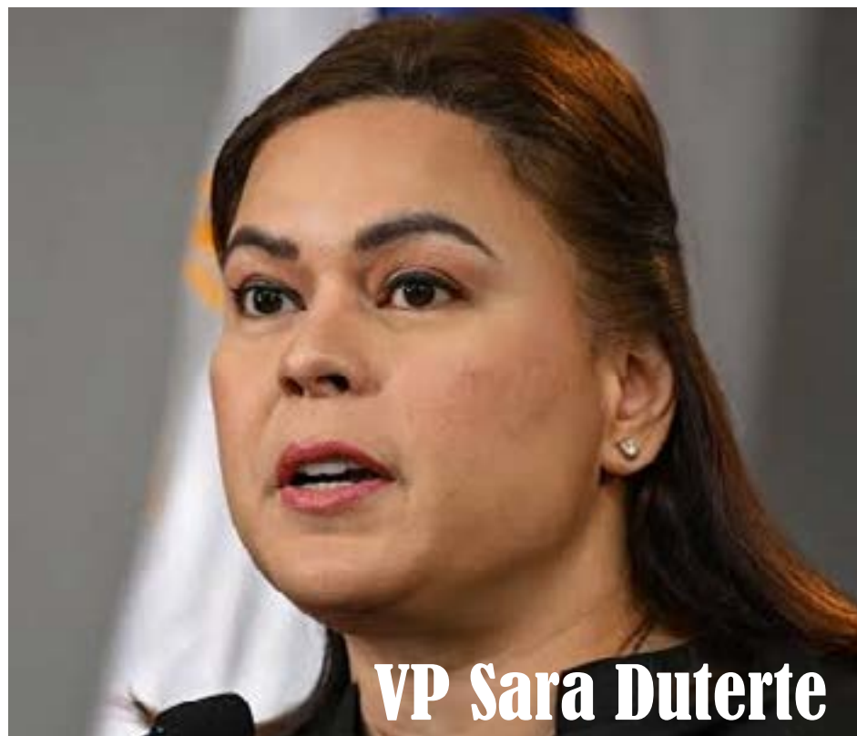
VP Sara Duterte

Binanggit din ni Chua na maaaring magdesisyon ang prosekusyon na huwag nang isulong ang