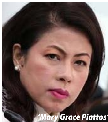
Vice President at ng Department of Education.