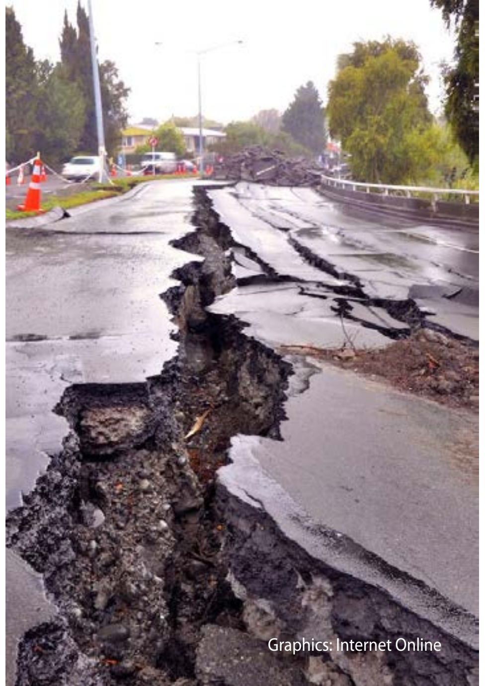
Graphics: Internet Online

• Tuturuan ang mga tao kung paano aalagaan ang lupa