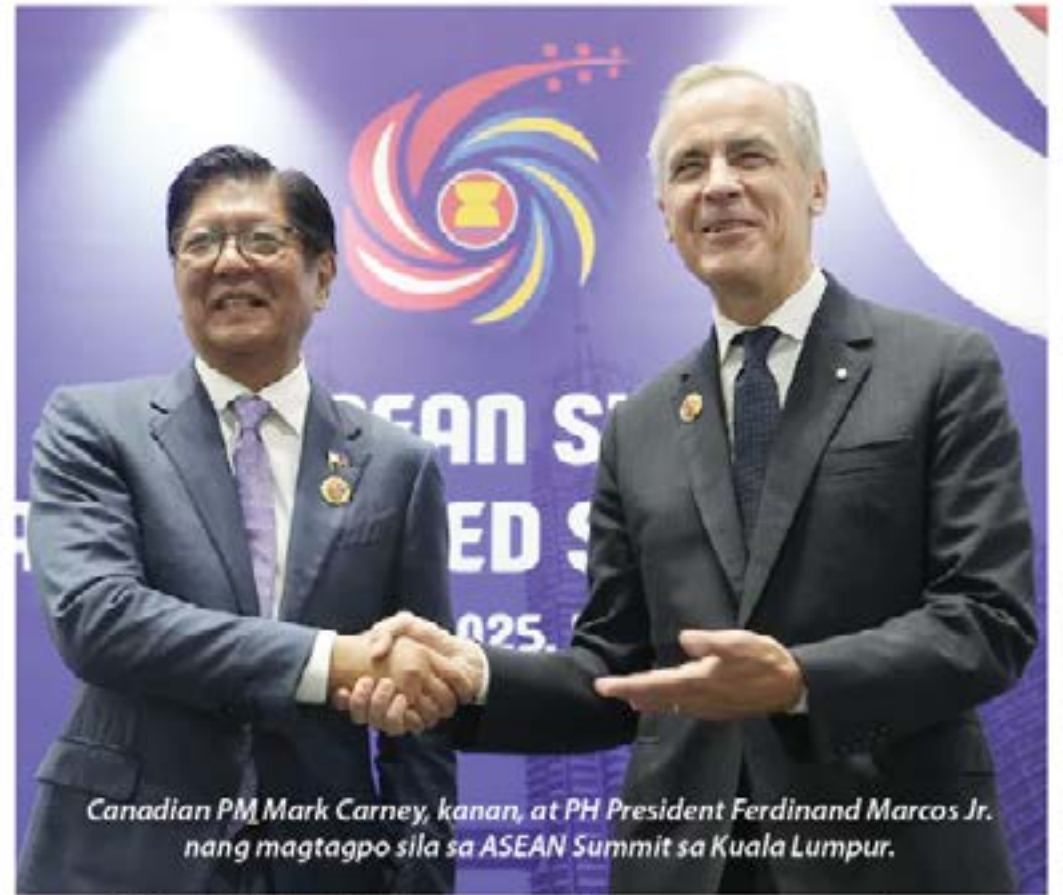
Canadian PM Mark Carney, kanan, at PH President Ferdinand Marcos Jr. nang magtagpo sila sa ASEAN Summit sa Kuala Lumpur.