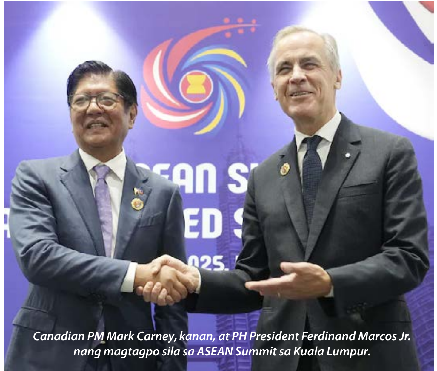
Canadian PM Mark Carney, kanan, at PH President Ferdinand Marcos Jr. nang magtagpo sila sa ASEAN Summit sa Kuala Lumpur.

Nitong nakaraang Mayo, bumisita si International Trade Minister Maninder Sidhu sa Pilipinas upang isulong