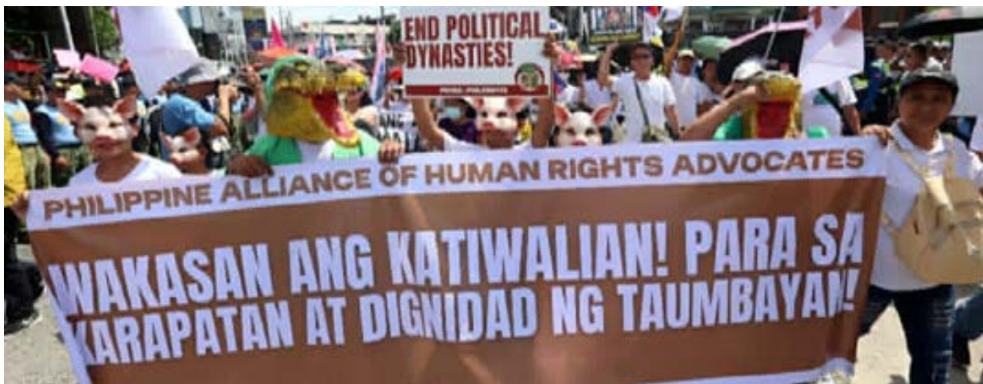
Lumahok ang iba't ibang religious groups at civil society organizations sa "White Ribbon March" na ipinangalanan na wakasan ang katiwalian at pagkakaisa sa katotohanan sa People Power Monument sa Quezon City.