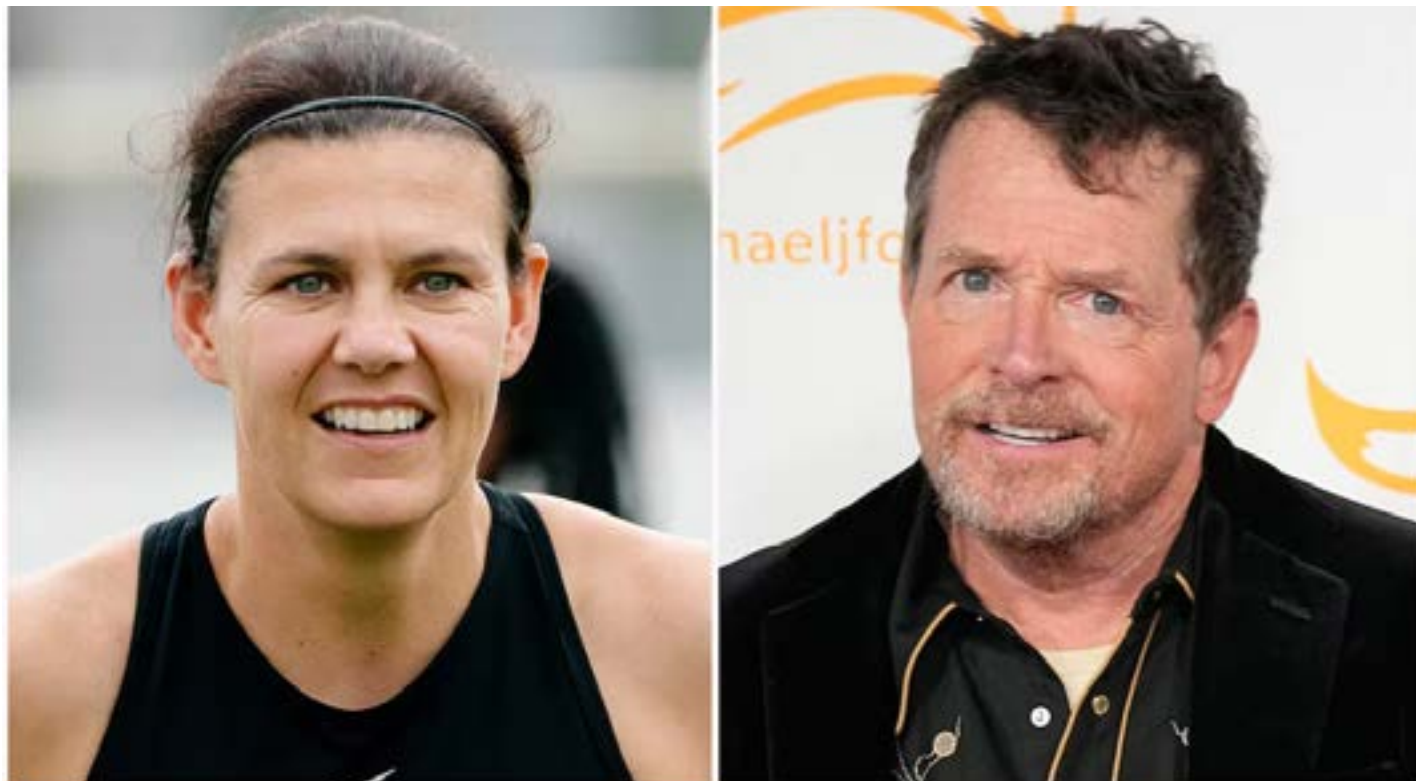
Soccer star Christine Sinclair at actor Michael J. Fox pinangalanan na companions of the Order of Canada.

These appointees, from diverse backgrounds and fields, reflect the talent and determination that shape Canada's future. At a time of profound global change, their achievements highlight the strength of Canadians and the values we repre-