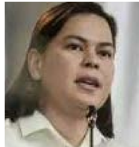
Vice President Sara Duterte

PILIPINAS- Binuweltahan ng Malakanyang si Vice Pres. Sara Duterte dahil sa pahayag nito na ang insidente ng pamamaril sa isang eskwelahan sa Tacloban City ay dahil sa kabiguan ng pamahalaan na kilalanin ang kahalagahan ng intelligence gathering at pagtukoy sa mga posibleng banta.