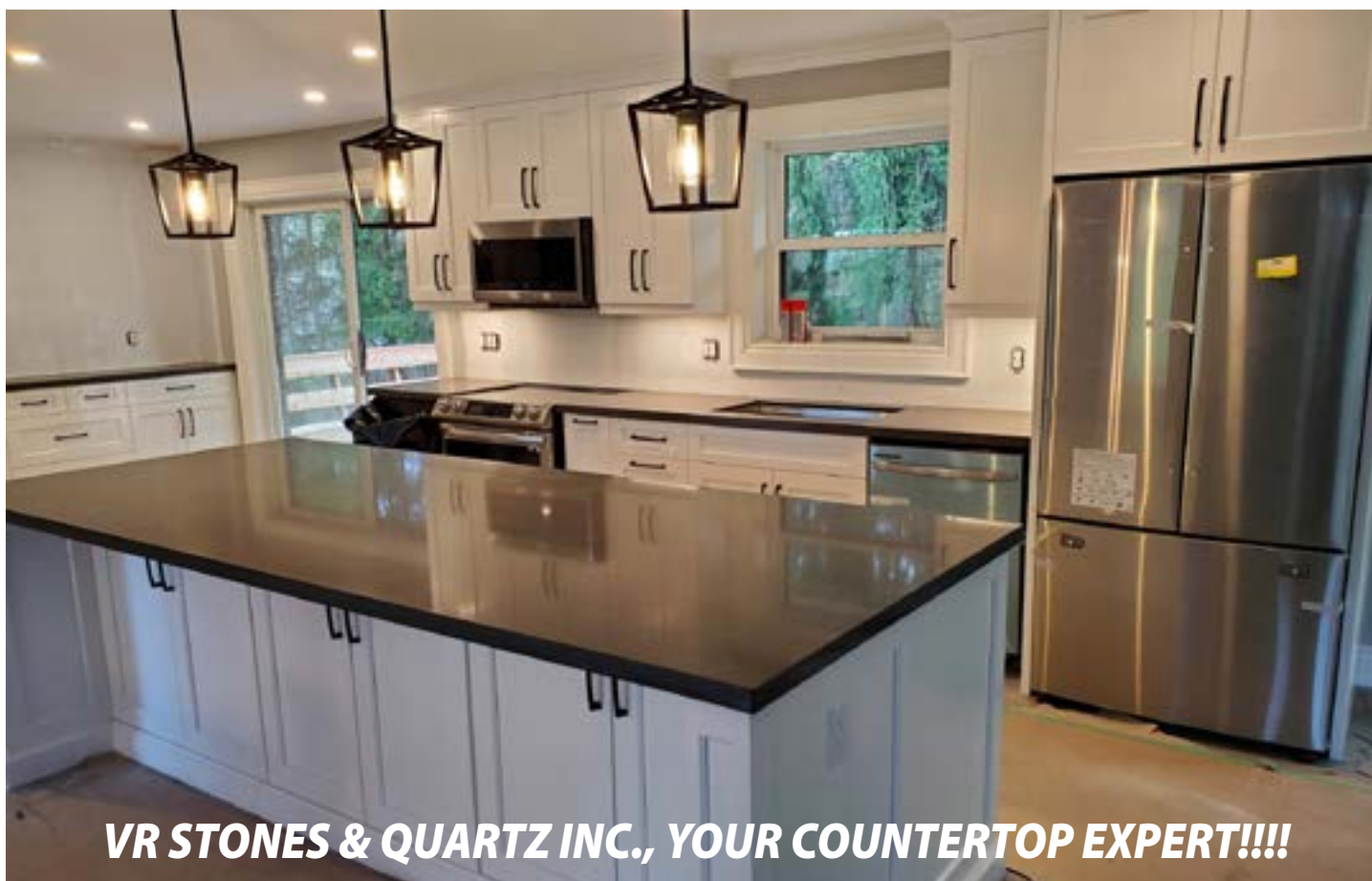
VR STONES & QUARTZ INC., YOUR COUNTERTOP EXPERT!!!!

Our clients include both residential and commercial customers, as well as builders and designers. For all your countertop needs, please feel free to call us and experience what all our satisfied clients have experienced from us!