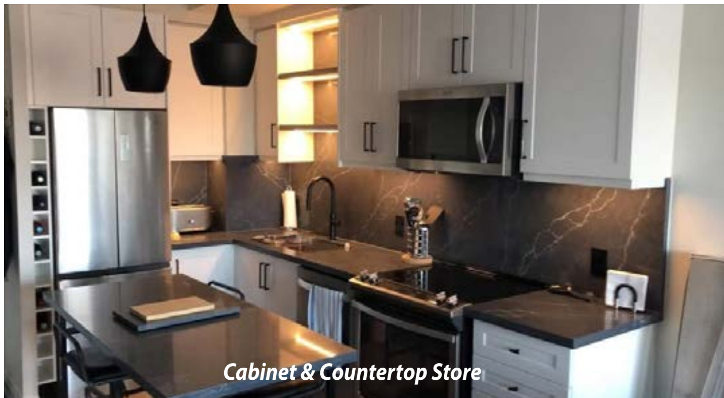
Cabinet & Countertop Store

At VR Stones & Quartz Inc., we personally involved in every project from the beginning stages of planning to final installation, ensuring the results you see at completion are exactly what you envisioned. We take a hands-on, individual approach to work with each of our clients, focus on the quality, superior service and client satisfaction.