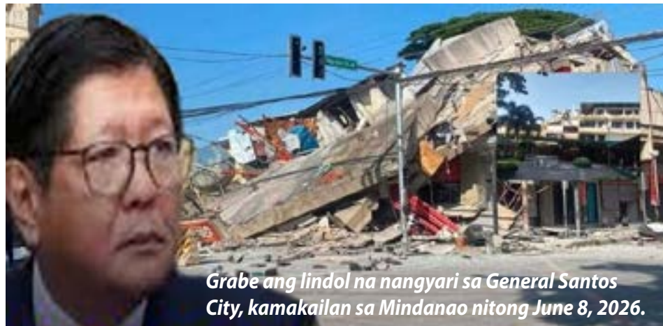
Grabe ang lindol na nangyari sa General Santos City, kamakailan sa Mindanao nitong June 8, 2026.

PILIPINAS — Umabot na sa 68 ang nasawi matapos ang magnitude 7.8 na lindol na tumama sa Maasim, Sarangani, na nagdulot ng malawakang pinsala sa mga gusali at mahahalagang imprastraktura, ayon sa Office of Civil Defense (OCD).