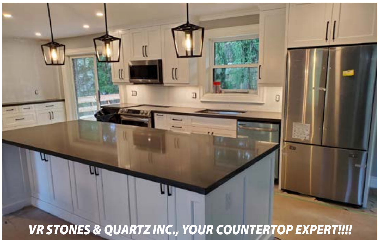
VR STONES & QUARTZ INC., YOUR COUNTERTOP EXPERT!!!!

Our clients include both residential and commercial customers, as well as builders and designers. For all your countertop needs, please feel free to call us and experience what all our satisfied clients have experienced from us!