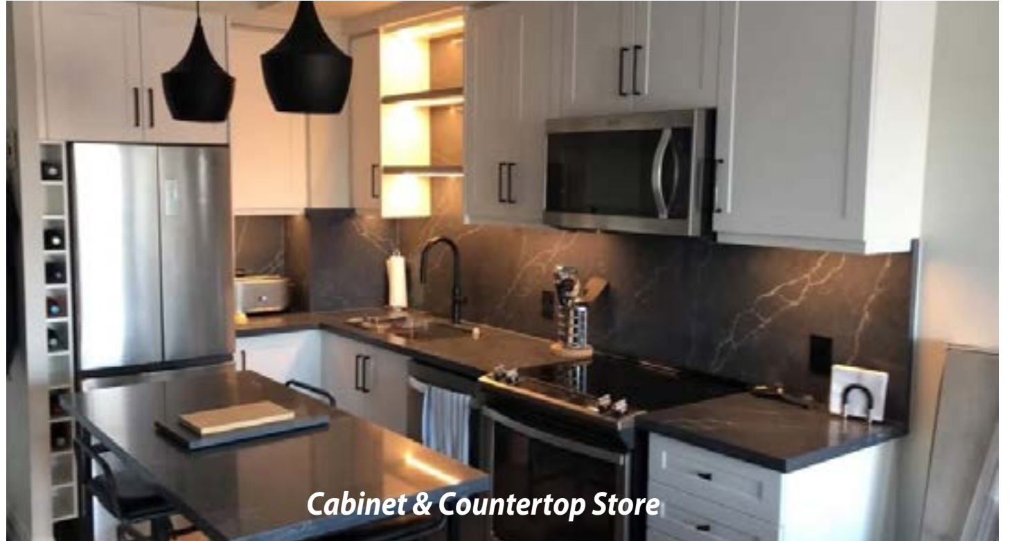
Cabinet & Countertop Store

At VR Stones & Quartz Inc., we personally involved in every project from the beginning stages of planning to final installation, ensuring the results you see at completion are exactly what you envisioned. We take a hands-on, individual approach to work with each of our clients, focus on the quality, superior service and client satisfaction.