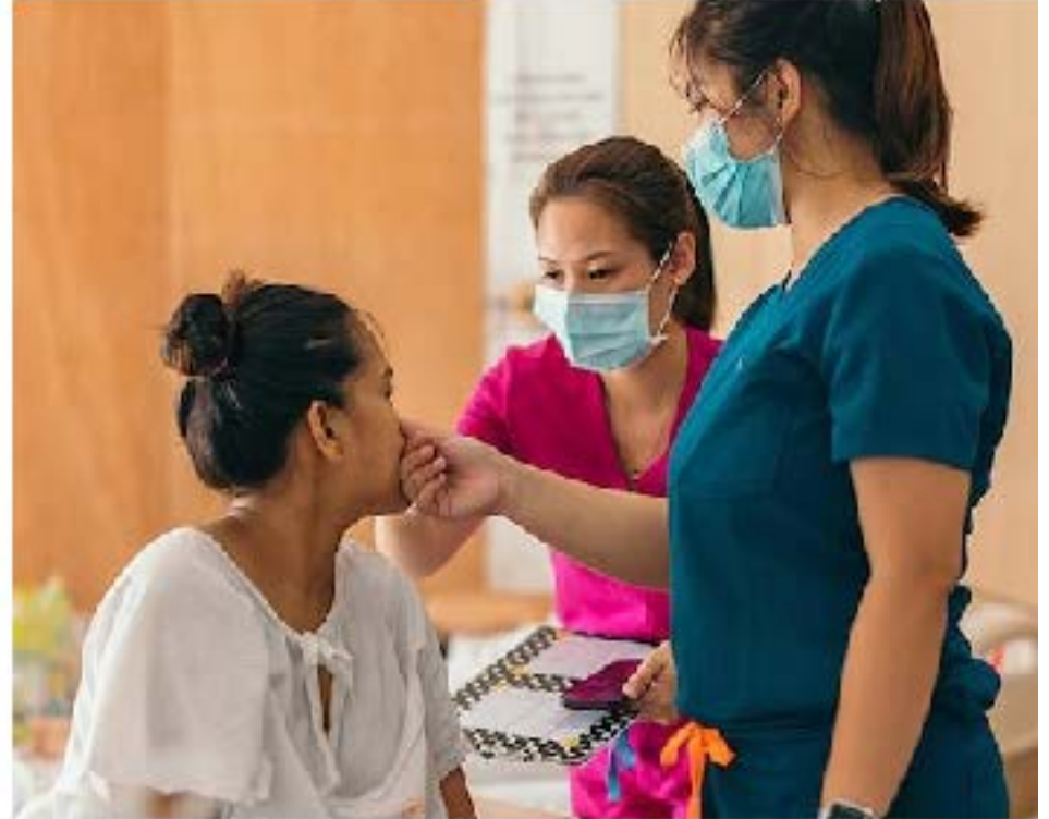
Ang mga nars tsinek ang isang pasyente sa Dr. Jose Fabella Memorial Hospital sa Maynila, Hunyo 16, 2025

Habang ang mga pulitiko sa Canada aynagsasalita tungkol sa tagumpay (bagong window) ng kanilang recruitment efforts sa Pilipinas, kaunting detalye lamang ang isinapubliko sa paraan ng pagre-recruit ng mga nars sa ibang bansa. Nanatili ang CBC News ng ilang linggo sa Pilipinas noong Hunyo 2025 upang matuto nang higit pa tungkol sa mga taong sangkot sa pagre-recruit ng mga Pilipinong nars para sa Canada, paano nila ito ginagawa at para maunawaan kung bakit napipilitan ang mga nars na umalis. Sa nakalipas na taon, ang gobyerno ng Saskatchewan (bagong window), New Brunswick (bagong window) at Manitoba (bagong window) at mga lider ng kalusugan ay nagpunta sa Pilipinas para mag-recruit ng mga nars.